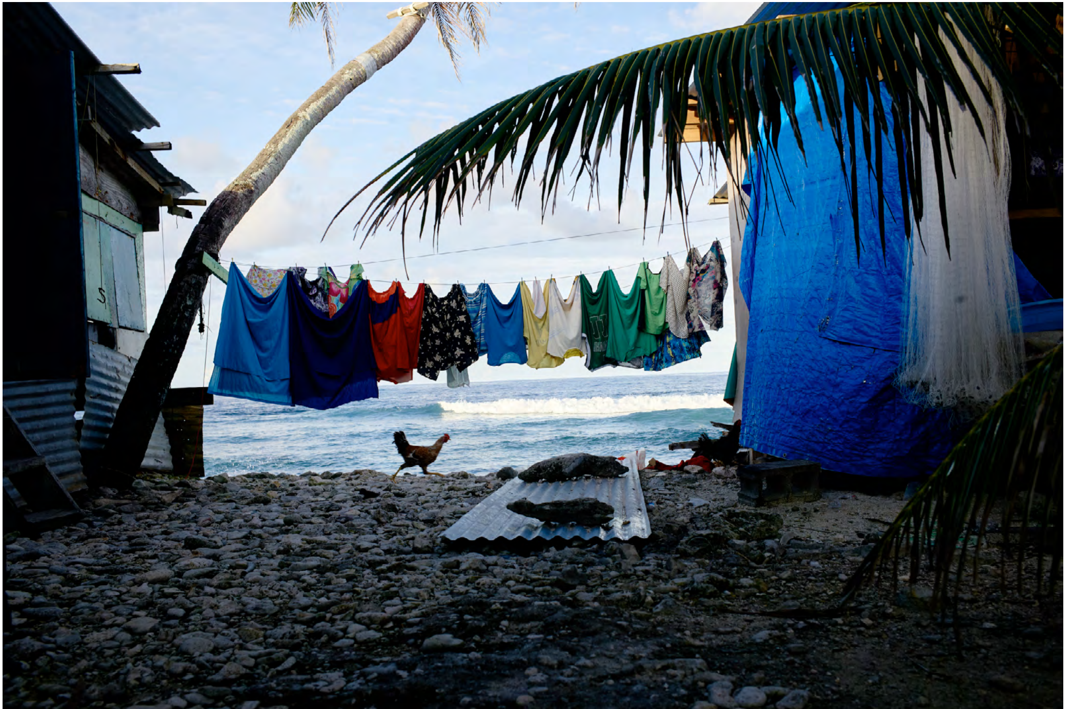
FUNAFUTI - TUVALU