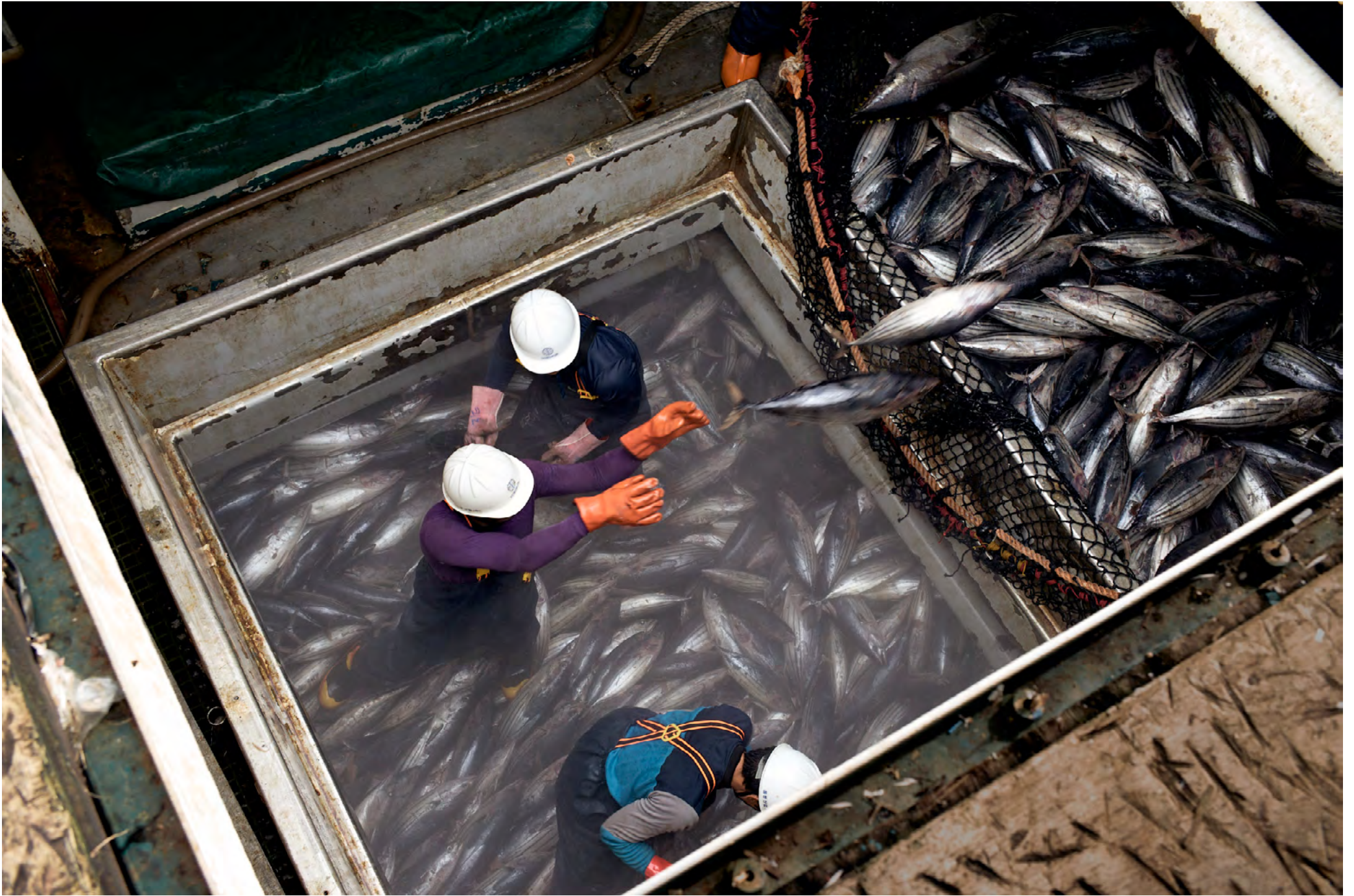
FUNAFUTI - TUVALU