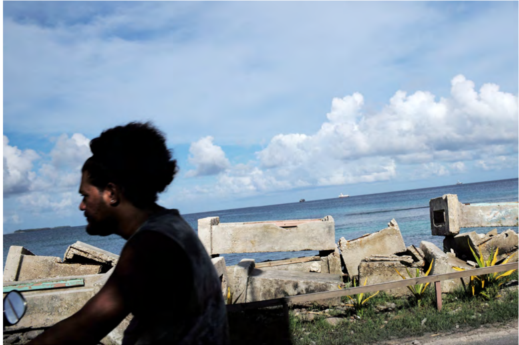
FUNAFUTI - TUVALU