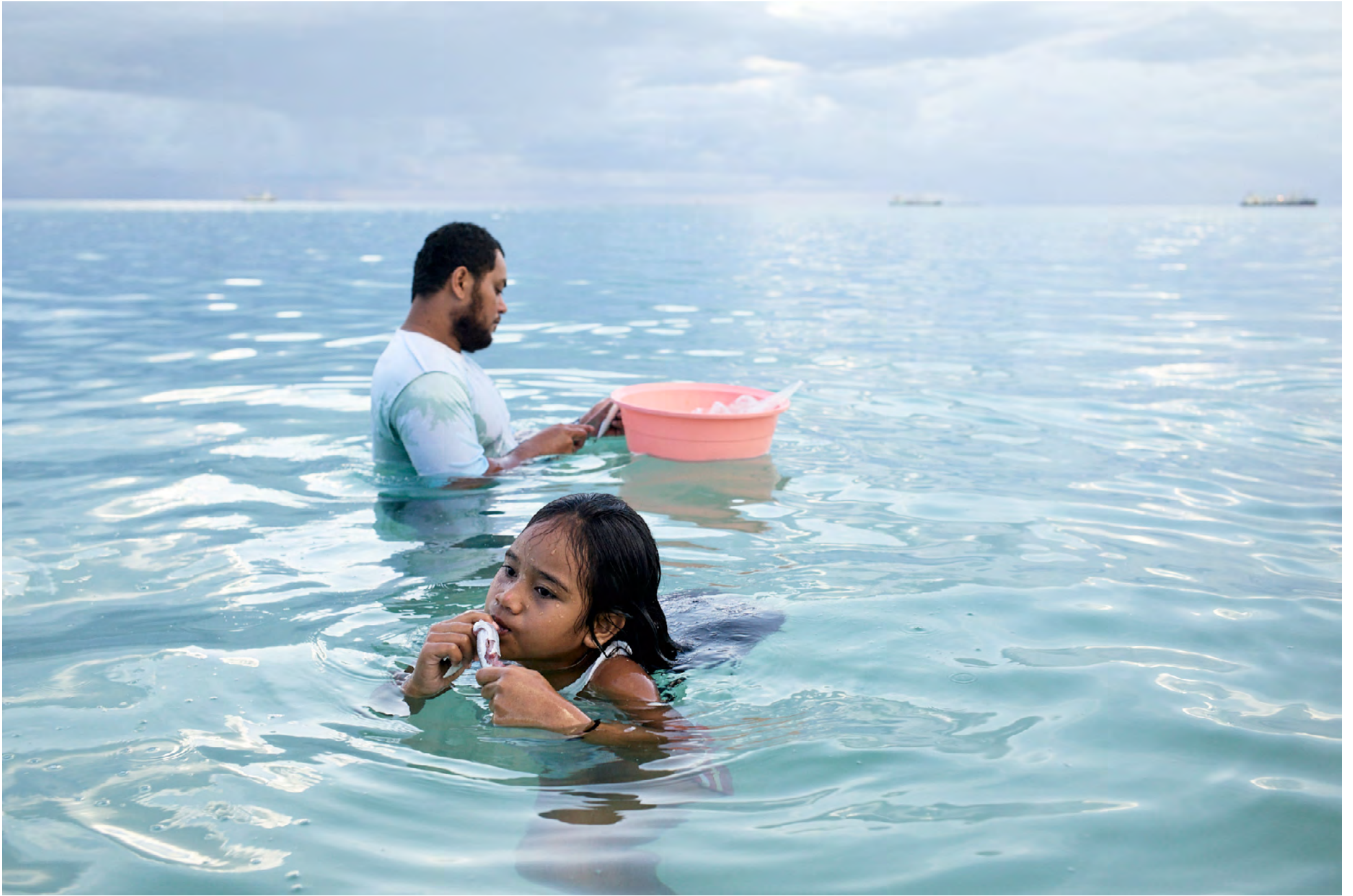
FUNAFUTI - TUVALU