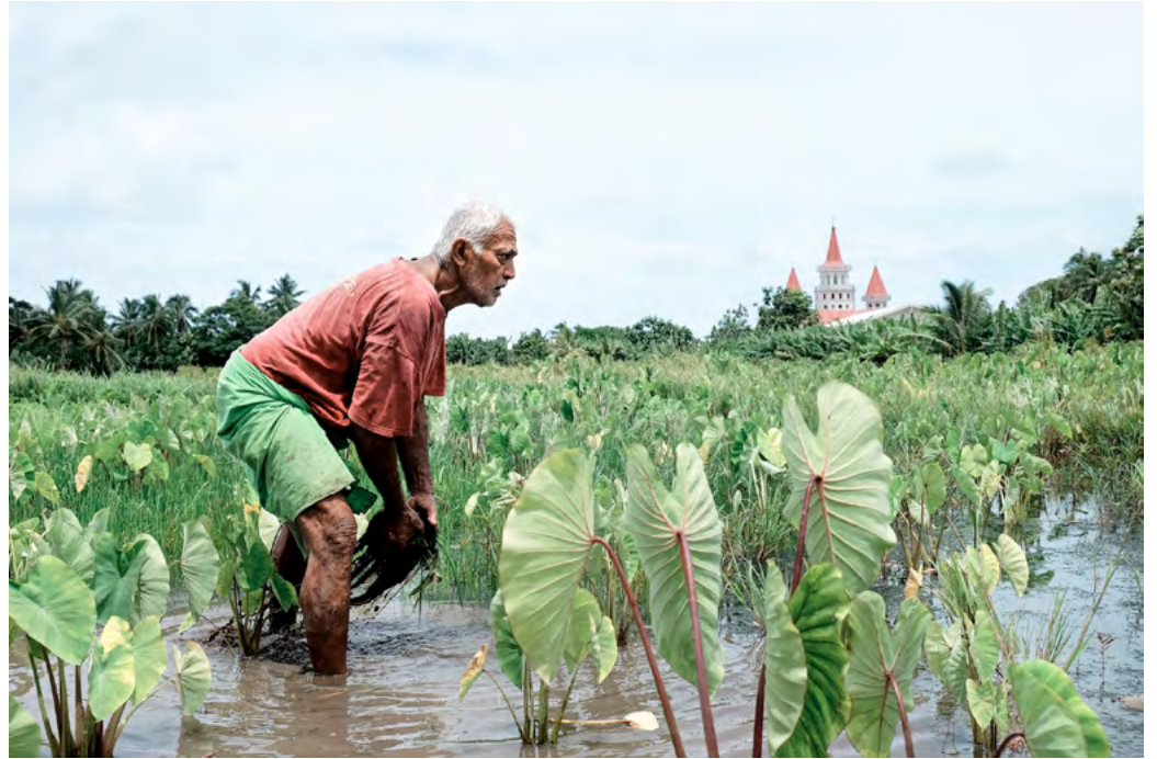
FUTUNA - WALLIS ET FUTUNA