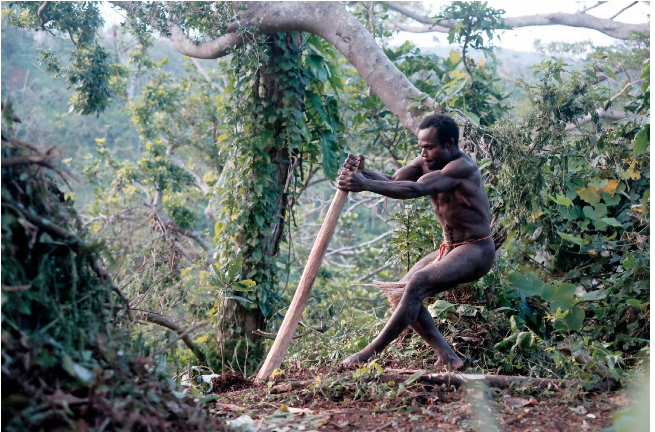
TANNA - VANUATU