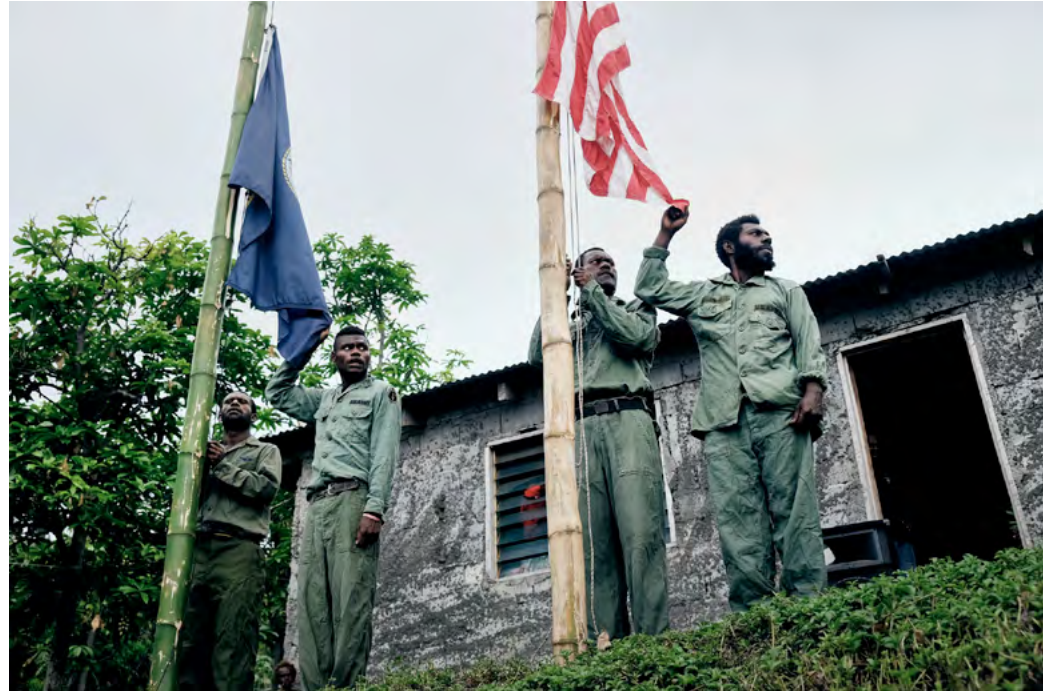
TANNA - VANUATU