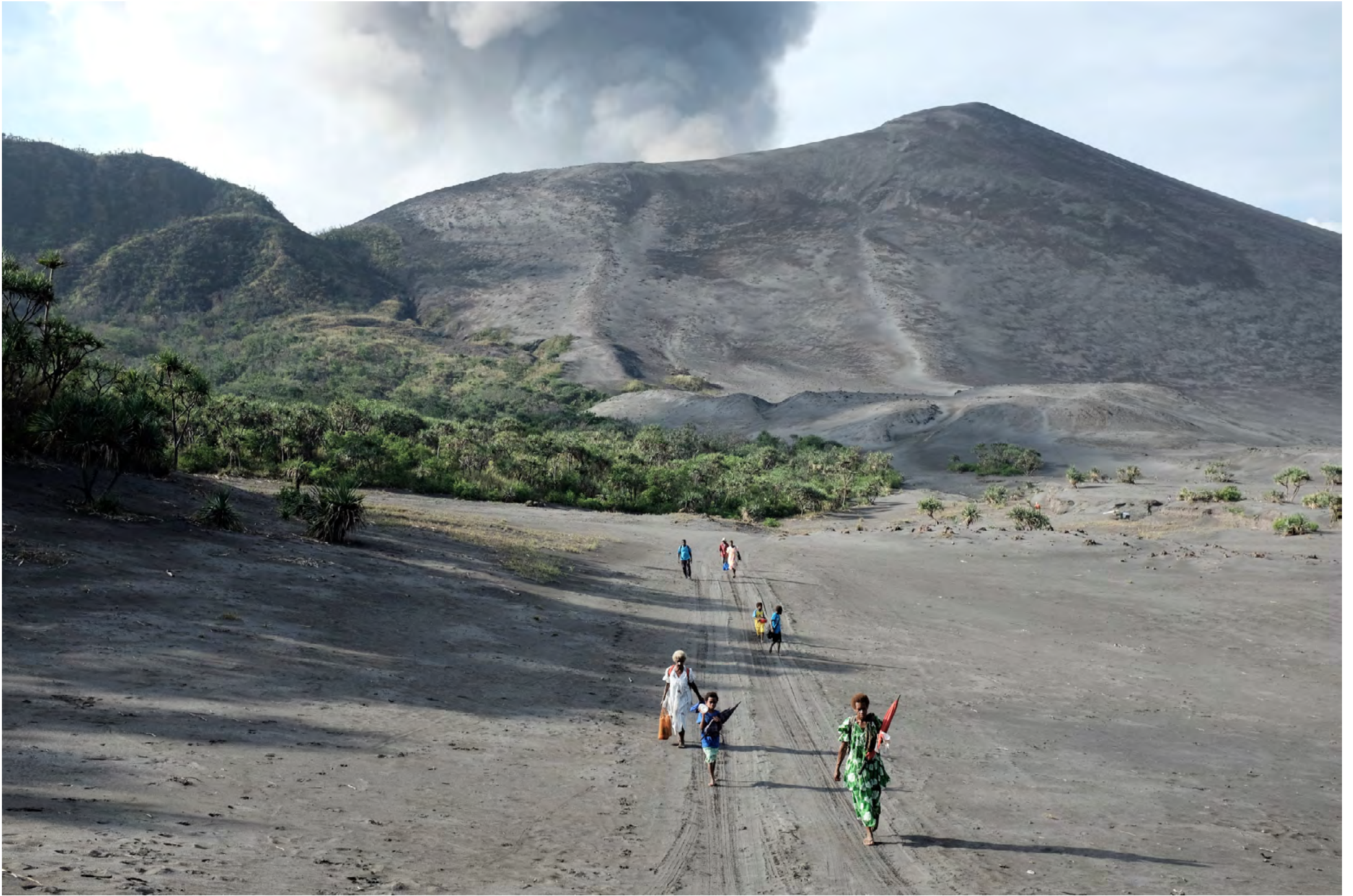
TANNA - VANUATU