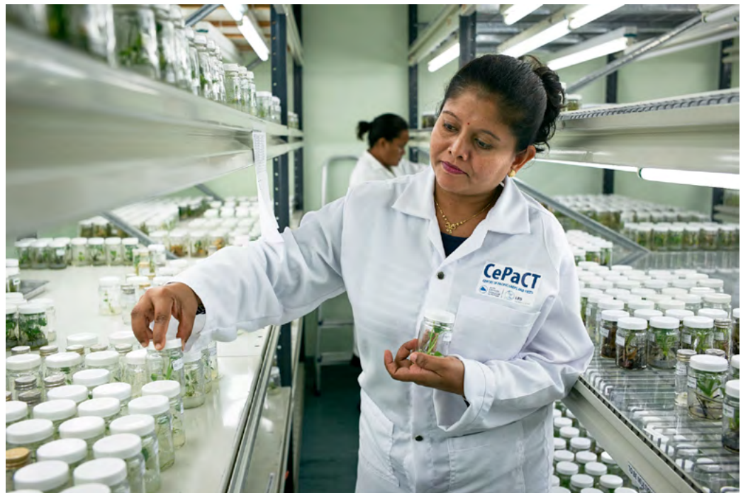
SUVA - FIDJI