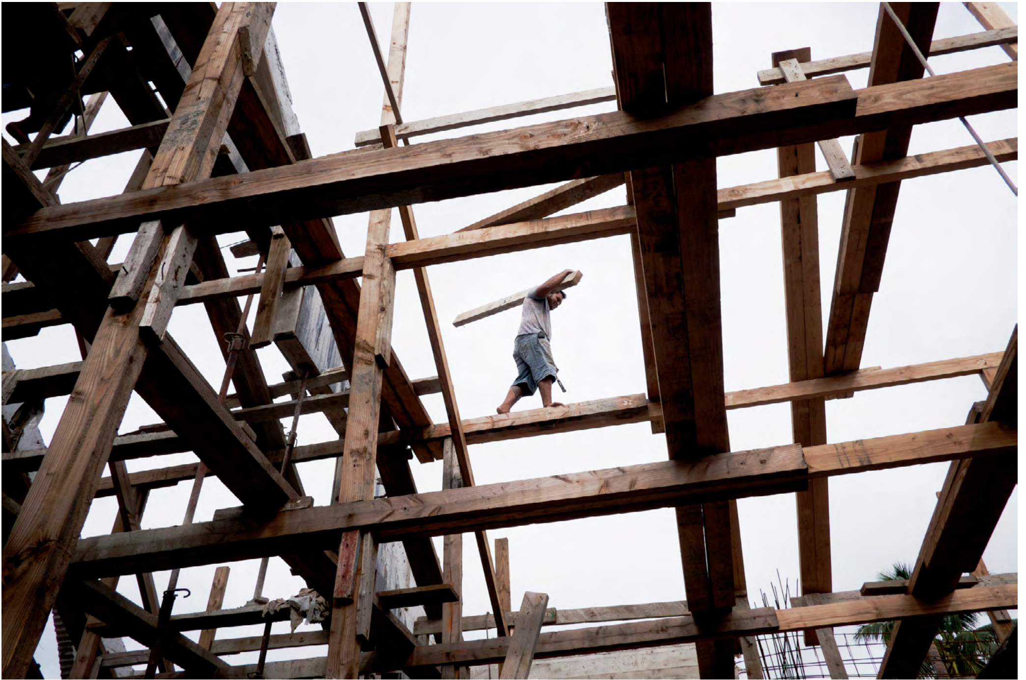
FUTUNA - WALLIS ET FUTUNA